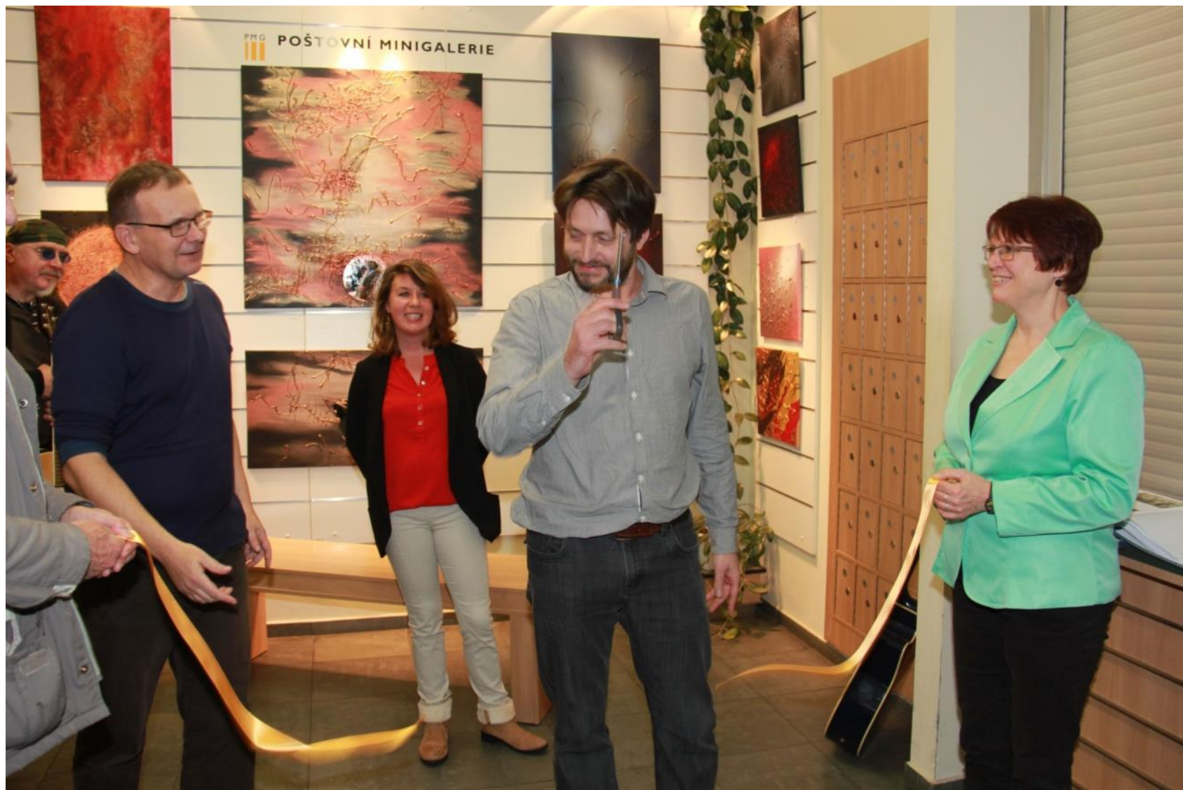
Slavnostní přestřižení pásky