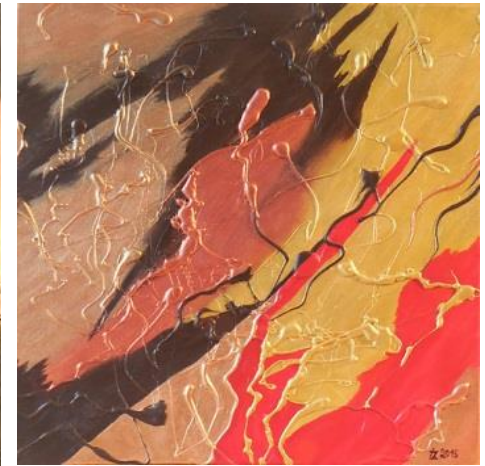
Pět Červená tma