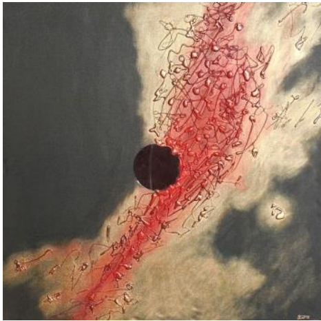
Ostrov myšlenek Invaze